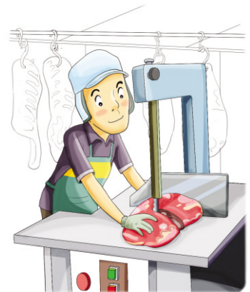
톱날 방호덮개 설치