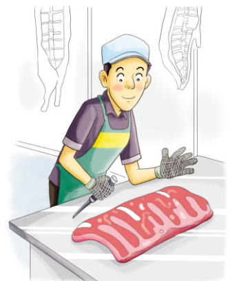
철제 또는 케블라 보호장갑 착용